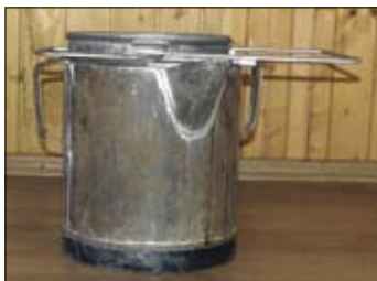
123. Kanva s cedidlom