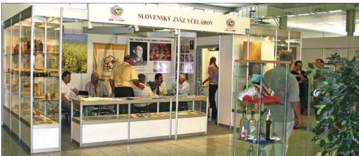
Napriek nižšej účasti návštevníkov výstavy bol stánok SZV takmer stále plný.