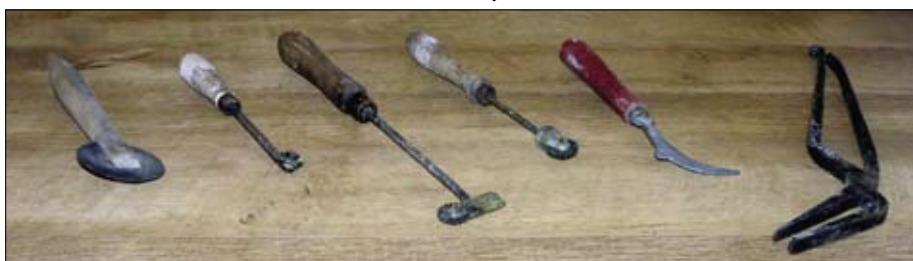
121. Kolieska na medzistienky, vypačovadlo a kliešte na plásty