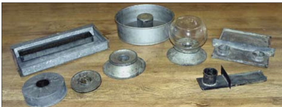
120. Rôzne druhy krmidiel

K pôvodným komposorátnym zbierkam patrili aj predmety hradnej zbrojnice. Po reštaurátorských a obnovovacích prácach interiérov stredného hradu – Korvínovho paláca začiatkom 20. storočia miestnosti doplnili o kópie stredovekého nábytku. Múzeum Oravského komposorátu v roku 1956 premenovali na Oravské vlastivedné múzeum. V roku 1980 ho spojili