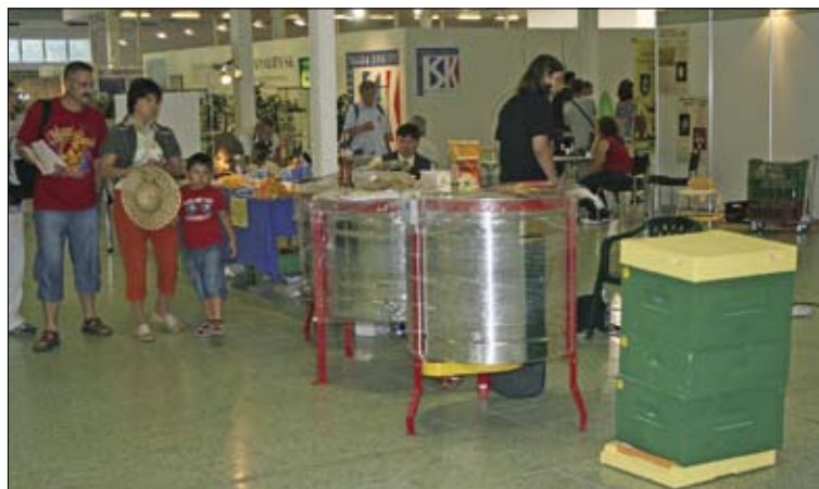
Medomety – typická a lákavá kulisa včelárskych výstav.