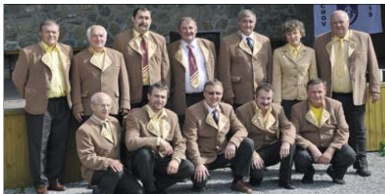
Uniformovaných včelárov pribúda.