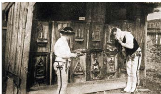
126. Včelín v Lieseku

s Múzeom P. O. Hviezdoslava v Dolnom Kubíne a Oravským vlastivedným múzeom, čím na Orave vzniklo jediné múzeum pod názvom Oravské múzeum so sídlom v Dolnom Kubíne. Pod správou Oravského múzea patrili Oravský hrad v Oravskom Podzámku, Literárne múzeum P. O. Hviezdoslava a Čaplovičova knižnica v Dolnom Kubíne, Múzeum oravskej dediny v Zuberci a Expozícia Hviezdoslavovej Hájnikovej ženy v Oravskej Polhore. V roku 1983 prevzalo múzeum do svojej správy Pamätný dom Martina Kukučína v Jasenovej a zároveň v uvedenom roku došlo k opätovnému premenovaniu múzea na Oravské múzeum P. O. Hviezdoslava. Tento názov nesie múzeum dodnes. Múzeum oravskej dediny ( skanzen ) v Zuberci bolo verejnosti sprístupnené v roku 1975. V roku 1991 prešiel delimitáciou nehnuteľný majetok Múzea oravskej dediny pod správu obce Zuberec.