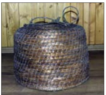
124. Rojochyt zo slamy