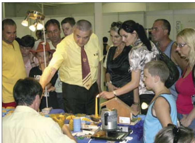
Hostí z ministerstva pôdohospodárstva zaujala výroba voskových figúr a sviec.