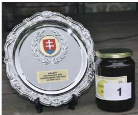
Tanier pre víťaza.