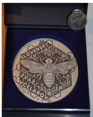
Vyznamenanie II. stupňa – Strieborná včela