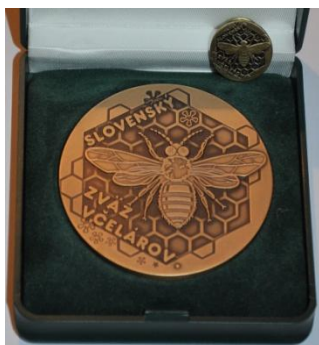
Vyznamenanie III. stupňa – Bronzová včela