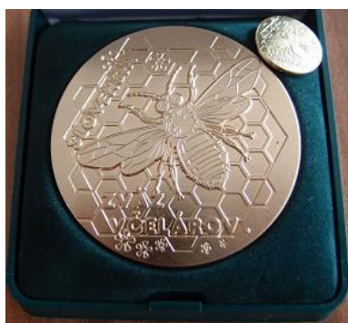
Vyznamenanie I. stupňa – Zlatá včela