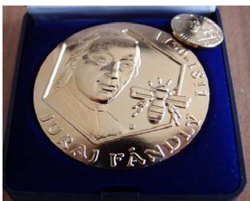
Vyznamenanie - Juraja Fándlyho